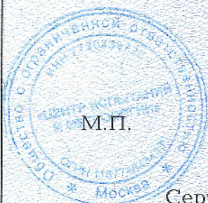
Схема сертификации: 3с.